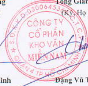
Đặng Vũ Thành