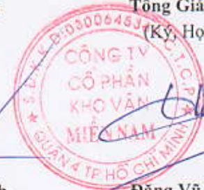
Đặng Vũ Thành