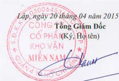
Đặng Vũ Thành