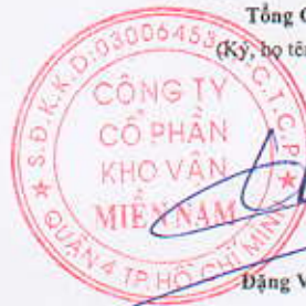
Đặng Vũ Thành